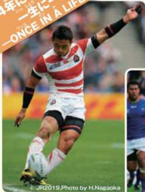
JR2019, Photo by H.Nagaoka

胸元に桜のエンブレム。前回大会での初戦で、ラグビーワールドカップで2度優勝している南アフリカ代表を破り、世界をおどろかせた。世界を相手に堂々と戦う姿に注目!