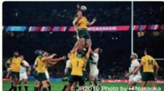
JR2019, Photo by H.Nagaoka

前回準優勝 / 世界ランキング6位 オーストラリアに生息し、すばしっこく走るワラビーになぞらえた「ワラビーズ」が愛称。