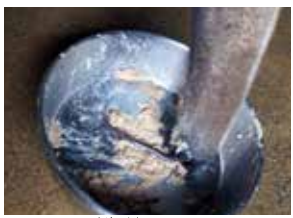
オオアリクイの長い舌

オオアリクイは「アリクイ」 何を食べる？ オオアリクイは「アリクイ」という名前の通り、野生ではシロアリの主食とし、1日に3万匹ものアリや昆虫を食べています。歯は全く無く、ベタベタした長い舌にアリをくっつけて食べています。この舌は長さが60cmもあり、入り組んだ巣の中に入るアリを食べることが出来ます。動物園では、必要な量のアリを毎日供給しています。