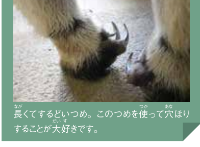
オオアリクイの特徴

秋の動物園まつり 10/8(土)から10月30日(日)まで「秋の動物園まつり」を3年ぶりに開催しました。期間中には「ジャガー」に馬肉の「エサやり」や「調理場ガイト」、「ワラビークイスに挑戦」など、さまざまな動物の体験型・観察型イベントが多数行われ、たくさんのお客様に普段では味わえない動物とのふれあいを楽しんでいただきました!