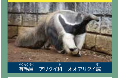
有毛目 アリクイ科 オオアリクイ属

学名: Myrmecophaga tridactyla 生息地: 中央、南アメリカの密林やサバンナ