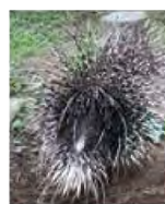
身を守るための背中

とまちはがえられることが多くですが、ヤマアラシとハリネズミは全く別の動物です。ハリネズミは「ネ