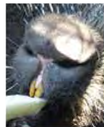
ネズミのしるし立派な前歯

とまちはがえられることが多くですが、ヤマアラシとハリネズミは全く別の動物です。ハリネズミは「ネ