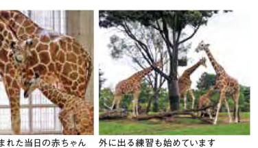
生まれた当日の赤ちゃん 外に出る練習も始めます

誕生した赤ちゃんはメスで、愛称は「来園者投票によって「エミリー」に決まりました。