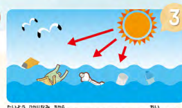
3 太陽の光・波の力でもろくなり、こわれて小さくなる