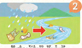
2 雨が降ると水路や川へ流れ出て海へ