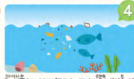
4 5mm以下のマイクロプラスチックになり魚などが食べる