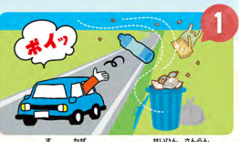
1 ボイ捨てや風でプラスチック製品が散乱