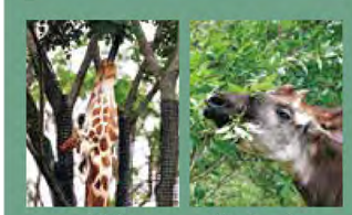
キリンの主食は、オカビと同じ木の葉です。40~50cmもある長い舌を上手に使って葉っぱを巻き取ります。