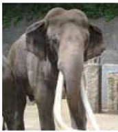
大きくてうすい耳

ゾウの体は特に目立つのは長い鼻と大きな耳です。ゾウの鼻は全て筋肉でできていて、骨はありません。また、とても力が強く器用なので、食べ物を