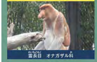
オナガザル科 霊長目