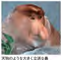
天狗のような大きく立派な鼻

天狗のような大きく立派な鼻!! テングザルは、ボルネオ島の沿岸部、川沿いに広がる密林に生息しています。テングザルの特徴として、大きく立派な天狗のような鼻があります。この天狗のような鼻は、テングザルの名前の由来にもなっています。また大きな鼻は、大人のオスにあり、大人のメスや子どもは小さな鼻です。なぜこ