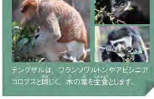
テングザルは、フランソワマンやアピシニアコブスと同じく、木の葉を主食とします。

2019年1月15日、スズラシアでテングザルの赤ちゃんが誕生しました! スズラシアでは2009年からテングザルの飼育繁殖に取り組み、今回が4回目の赤ちゃん誕生となります。生まれた赤ちゃんはオスで、愛称投票の結果