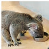
地面に下りることもあります