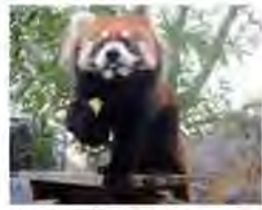
リンゴをつかむことができます

片手でしっかりリンゴをキャッチ！ レッサーパンダは竹の葉を主食にしていますが、動物園ではリンゴや圓形飼料なども与えています。中でもリンゴが大好物なので、ガイドのときには「リンゴ」を使ってお客さんの見やすい場所まで誘導しています。リンゴを食べるときは片手でつかんで口に運びますが、実はサルの子