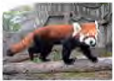
長いしっぽなど、ジャイアントパンダとは異なる特徴があります

片手でしっかりリンゴをキャッチ！ レッサーパンダは竹の葉を主食にしていますが、動物園ではリンゴや圓形飼料なども与えています。中でもリンゴが大好物なので、ガイドのときには「リンゴ」を使ってお客さんの見やすい場所まで誘導しています。リンゴを食べるときは片手でつかんで口に運びますが、実はサルの子