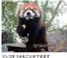
リンゴをつかむことができます

レッサーパンダは竹の葉を主食にしてますが、動物園ではリンゴや固形飼料なども与えています。中でもリンゴが大好物なので、ガイドのときにはリンゴを使ってお客さんの見やすい場所まで誘導しています。リンゴを食べるときは片手でつかんで口に運びますが、実はサルの子