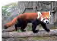
長いしっぽなど、ジャイアントパンダとは異なる特徴があります

間以外では片手で物をつかめる動物はとも少ないです。サルの仲間には手の親指が他の指と向かい合っように付いているのでしっかり物がつかめます。レッサーパンダの指は5本とも前を向いています。5本の指を折り曲げてリンゴをつかみます。実は手首に親指の代わりとなる小さな骨(種子骨)の突起があつて、つかんだ物を支えています。