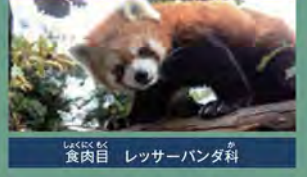
食肉目 レッサーパンダ科

学名: Ailuurus fulgens styani 生息地: ミャンマー北部から中国南部の標高2000m以上の竹の多い林