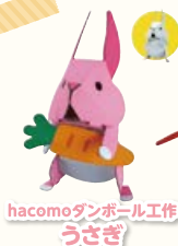
hacomodanboull 工作 うさぎ