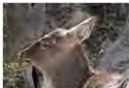
ツノが生え始めてから1週間後

シカってどんな動物？ 日本に住んでいるシカはニホンジカという種で、北は北海道、南は九州まで、いろいろな所にいます。森や草原で、草や木の葉、枝などを食べて暮らしていますが、住んでいる地域によつて体の大きさが異なり、呼び方も変わります。寒い所に住む物ほど体が大きくなり、