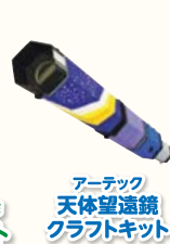
アーテック 天体望遠鏡 クラフトキット