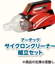
アーテック サイクロンクリーナー 組立セット