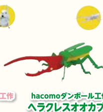
hacomodanboull 工作 ヘラクレスオオカブト