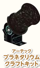
アーテック プラネタリウム クラフトキット