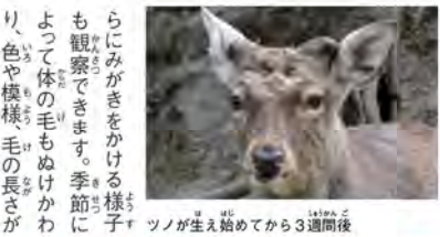
ツノが生え始めてから3週間後

北海道のエゾシカは、鹿見鳥の屋久島にいるヤクシカの約4倍の重さがあります。 オスにはツノがあり、秋の結婚の時期になるとメスをめぐってオス同士、ツノで戦います。しかし、このツノは一年に一度、生え変わるので、春になるとぬげ落ちてしまいます。 エゾシカの1年の変化