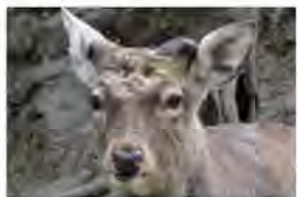
ツノが生え始めてから3週間後

らにみかぎをかける様子も観察できます。季節によつて体の毛もぬげかわり、色や模様、毛の長さががらりと変わるので、同じ種類の動物だとは思えないかもしれません。秋から冬にかけては、鳴き声を聞くことができます。今年エゾシカの1年の変化を、ぜひ自分の目で確かめてみませんか。