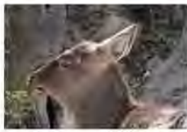
ツノが生え始めてから1週間後

シカってどんな動物？ 日本に住んでいるシカはニホンジカという種で、北は北海道、南は九州まで、いろいろな所にいます。森や草原で、草や木の葉、枝などを食べて暮らしていますが、住んでいる地域によって体の大きさが異なり、呼び方も変わります。寒い所に住む物ほど体が大きくなり、