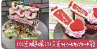
1/26(日) お菓子の家、2/11(火・祝)ハイビルカップケーキ教室

プロといっしょにお菓子づくりケーキデザイナー体験 日本で数少ないプロのケーキデザイナーに絞りにデコレーションを学びながら楽しく作ります。