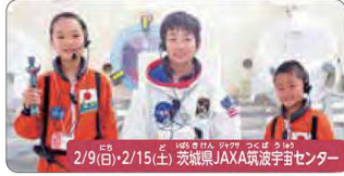
2/9(日)・2/15(土) 茨城県JAXA筑波宇宙センター

医学博士と長寿の秘密に迫るキッズクワター体験(循環器内科) 元・東京大学医学部附属病院のお医者さん、「血管のプロ」に学ぶ医療体験。リハビリの世界も体験します。