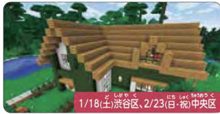
1/18(土)渋谷区、2/23(日・祝)中央区

宇宙兄さんズと宇宙ミッション体験! 本物の宇宙飛行士訓練施設(セキュリティエリア内)でミッション体験を行う特別なプログラム。