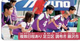
複数日程あり 足立区 調布市 藤沢市

プロといっしょにお菓子づくりケーキデザイナー体験 日本で数少ないプロのケーキデザイナーに絞りにデコレーションを学びながら楽しく作ります。