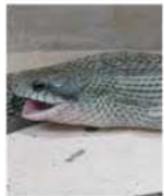
えものを飲みこみ伸びる皮膚

えものを丸のみ？ へびのあごと皮膚 アオダイショウは、日本各地に分布する青みがかった色をした全長100〜190cmほどのヘビです。木登りが得意で、屋根裏に登り、食べ物をあらずネズミを食べることもから、「守り神」として大切にされることもありま