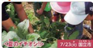
＜夏のイチオシ＞ 7/23(水) 国立市

みらい農園フェスティバル in くにはちたけんぼ 忍者・ドラムサークル・農園で生き物探しの3つを 体験！親子で思い出に残る夏の1日を。