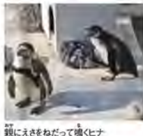
親にえさをねだって囁くヒナ

暖かな所で暮らしているペンギンというイメージがあると思われていますが、実は、世界に生息している全18種類のペンギンのうち、南極大陸に生息し繁殖まで行っているのは2種類しかありません。