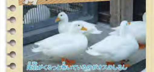
尾羽がぐるぐるしているのがオスのしるし

地球上にともに生きる動物たち。彼らの生き方や暮らしを見つめると、いのちや自然の大切さが見えてくる。