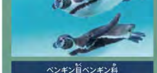
ペンギン目ペンギン科

学名: Spheniscus humboldti 生息地: ペルーやチリの太平洋沿岸