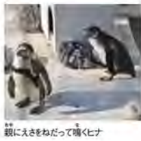
親にえさをわけてくちくちく

暖かな所で暮らしているペンギンというイメージがあると思いがちですが、実は、世界に生息している全18種類のペンギンのうち、南極大陸に生息し繁殖まで行っているのは2種類しかありません。