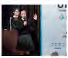
参考：(公財)日本ユニセフ協会ウェブサイト「学校のための持続可能な開発目標ガイド」

中高生を対象とした「第2回 Change Maker Awards」の募集が始まったよ。この大会は、個人部門と団体部門があり、それぞれのテーマについて英語でプレゼンテーションをするんだ。金賞、銀賞、銅賞のほか「Global Link賞」にはシンガポールで開催される国際コンテストへの招待も！中高生のお兄さん、お姉さんたちが