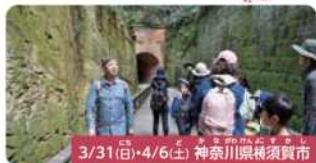
3/31(日)・4/6(土) 神奈川県横浜須賀野市

[全4回] 季節の旬をいただく!やさしい畑体験 農業のプロといっしょに旬の野菜で「植える→収穫する→食べる」という流れを楽しめる、農園ならではの体験です。