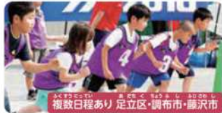
複数日程あり 足立区・調布市・調布市

マイクラで遊んで考える!世界の課題解決体験(SDGs:パージョン) マイクラソフトの世界を舞台に、チームになって総理大臣・外務大臣として仮想国を運営します。