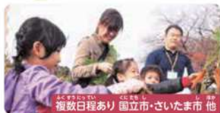
複数日程あり 国立市・さいたま市 他

先生はその道のプロ!「やりたい」「知りたい」をぐっと引き出します 体験は200種類以上!たくさんのおタネをまいてあげませんか 当日は親子いっしょに!楽しく特別な思い出を作りましょう