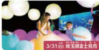
3/31(日) 埼玉県富士見市

ミスノが教えるかけこ教室!運動会必勝講座 通算1000組以上の親子が参加した人気体験。かけこが早くなる4つのポイントを学びます。