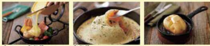
真たくさん北海道フレット 北海道つくしのカルボナーラライス やりすぎじゃかバター

他にも、北海道のチーズ工場のこだわりをつめこんだピザやソフトクリーム、各種ドリンクなど、おいしいメニューがたくさんあるよ！ 詳しくはホームページまで！ ミルクランド北海道 検索