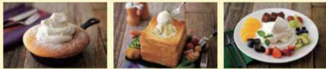
スキレットのダブルクリームパンケーキ チーズパンデュー 季節のお皿パフェ