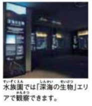
水族園では「深海の生物」エリアで観察できます。