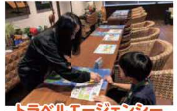
トラベルエージェンシー