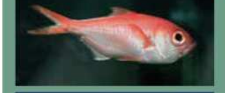
キンメダイ目 キンメダイ科