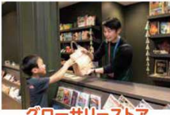
グローサリーストア