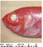
光を反射して金色に見える目

な光を利用するために、このような大きな目が必要なのです。ささいな目の奥にはタペータムと呼ばれる鏡のような部分があり、目に入った光を反射させ、効率よく利用できる仕組みになっています。