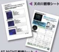
GLOBE AT NIGHT 観察シート ▲

「天の川観察シート」(GLOBE AT NIGHT 観察シート)は、下記のサイトからダウンロードしてね。 http://www.env.go.jp/press/106271.html