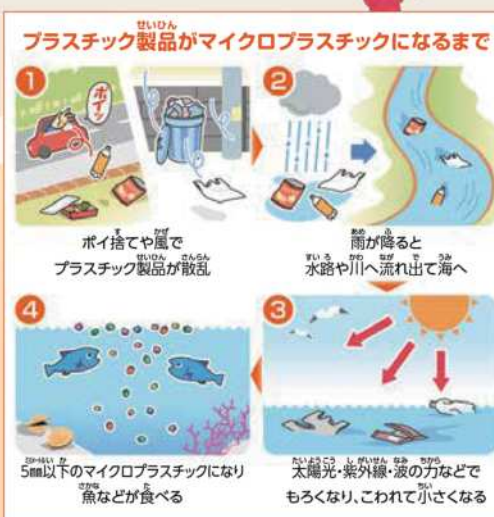
参考元：平成30年7月環境省発表「海洋プラスチック問題について」

細かくくだけたプラスチックやペットボトル、ビーチサンダルなど、さまざまなごみが散らばっているね。