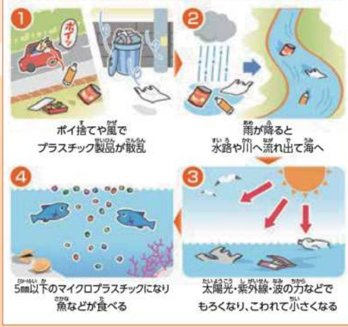
参考元：平成30年7月環境省発表「海洋プラスチック問題について」