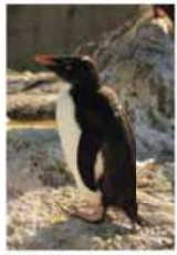
幼鳥は頭に生える黄色い羽が短い

このペンギンは、南極海の周辺にある寒い気候の鳥なので暮らしているため、暑いのは苦手です。水族園では、暑い時期は展示場ではなく、冷房が効いた飼育室で過ごすため、会えるのは秋から春の間です。また、夏の間には子育てが行われると、秋には展示場で子ども(幼鳥)のミナミワトビペンギンを観察できます。子どもは頭に生える黄色い羽がとて短いので、大人(成鳥)と見分けることができます。展示場で子どもを見つけたら、大人と見比べてみてください。