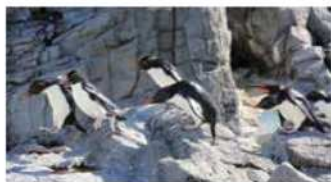
岩の上を飛び跳ねて移動する

ペンギン界のオシャレリーダー!? あざやかな赤い色の目にオレン色のくちばし。頭には黄色の長い羽が生えたミナミワトビペンギン。岩の上をジャンプジャンプと飛び跳ねるように移動することから、英語では「ロックホッパー」と呼ばれています。