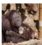
抱き合うジュリーとチュリア、のぞき込むリキ

樹上で暮らす最大の哺乳類 オランウータンは東南アジアにあるボルネオ島とスマトラ島にのみ生息する大型の類人猿です。類人猿には、チンパンジーやゴリラなどがありますが、木の上で生のはんとを過ごすのはオランウータンだけです。木の上で暮らす動物の中ではもっとも大きく、メスは35〜50kg、オスは60〜90kgあります。基本的には単独で生活していますが、メスは子供が生まれるまで6〜9年かけて子育て 1900年代には32万頭いたとされている野生のオランウータンですが、現在は6万頭ほどしかおらず、このままでは絶滅すると言われています。その要因の1つは私達日本人にも関係があります。 オランウータンが住む森は90年代から徐々に伐採され、アブラヤシという木が植えられました。アブラヤシは少ない実から良い油がたくさんとれます。この油はパーム油と呼ばれています。