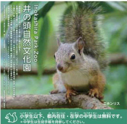
井の頭自然文化園 Hokushira Park Zoo 二ホンリス

次号のエコチル配布予定日は5月7日(月)です。エコチルは東京都23区の小学校751校で配布している。子ども環境情報紙です。都内にある児童館135館でも設置しています。エコチル編集部 TEL. 03-6821-3525