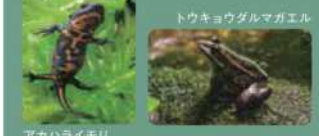
トウキョウダルマガエル アカハライモリ