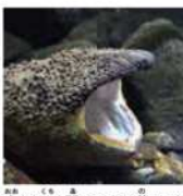
大きな口を開けてエサを飲みこむ

体は茶色と黒のまだら模様で、川の石などにまがれてとも見つけにくい。おまんじゅうのような頭には、小さなイボがたくさん付いており、これも川の石にそっくり。小さな目もイボと区別がつきにくくなっている。大きな獲物である魚などが近づかずに近寄ってしまうのも仕方がないくらい、みごとに身をかくしているんです。そして、小さな目で獲物を見つけ、動きを体で感じながら待ちぶせ。近づいてきたところを大きな口でとらえます。口には細かい歯がたくさん生