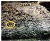
オオサンショウウオの目の位置は?

オオサンショウウオの目の位置は? 近くで見ると、目が口より少し上にある。口は細い歯がたくさん生