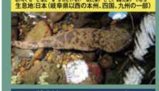
有尾目オオサンショウウオ科

学名: Andrias japonicus 生息地: 日本(岐阜県以西の本州、四国、九州の一部)