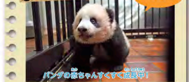
パンダの赤ちゃんすくすく成長中!

今年6月に生まれたジャイアントパンダの赤ちゃんは、生後120日で体長約70cm、体重およそ8kgと順調に大きくなっています。さらに、32万羽をこえる候補の中から名前も「ジャンジャン(香港)」と決まり、これからのジャイアントパンダの未来をつくっていくようにと願っています。公開は今年の12月くらいかな? *