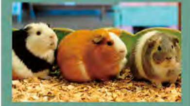
げっ歯目テンジクネズミ科