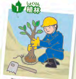
1 植林 定期的に、木の苗を手作業で植えていく