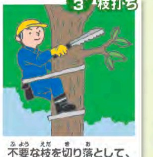
3 枝打ち 不要な枝を切り落とし、木をより元気に