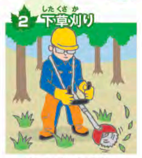
2 下草刈り 苗木に太陽の光が当たるよう、雑草を刈る