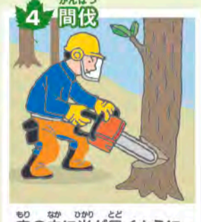
4 間伐 森の中に光が届くように、一部の木を間引く