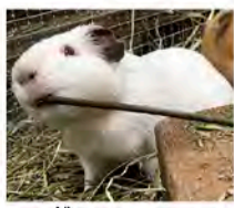
かたい枝をかじるモルモット

みんな同じ？ ネズミの仲間 姿や形、大きさも全く異なりませんが、モルモット(テンジクネズミ)とカビバラ、アフリカタテガミヤマアラシは、すべてげっ歯目に属するネズミの仲間です。げっ歯目の動物は、哺乳類の中ではもっとも種類が多く、1600種以上もいるといわれています。南極とニュージーランドを除く世界中に分布し、様々な環境に適応しています。