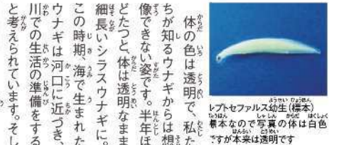
レプトセファルス幼生(稚魚)の着本なので写真の体は白色ですが本来は透明です

なぞの多いウナギ ウナギはおいしい魚として、昔から日本人に親しまれてきましたが、その生態は長い間なぞにまつまてきました。昔のなぞは、どこで卵を産んでいるかわからないことでした。しかし、近年の研究により、ニホンウナギは日本から2,500kmもはなれた海の中で産卵していることがわかり、その生態が少しずつ明らかにされてきました。