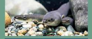
ウナギ目 ウナギ科