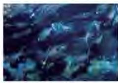
水そうの中で光りながら泳いでいるヒカリキンメダイ

光る魚を観察しよう！ 海の中には、光る物質を体の外に出したり、また体の一部分を光らせたりにすることができるといいます。水族園の新しい展示「発光生物」コーナーで、一番大きな水そうをのぞいてみてください。青い光が、ピカピカ点滅しているのがわかります。これは、ヒカリキンメダイという魚