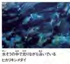
水の中で光りながら泳いでいるヒカリキンメダイ

光る魚を観察しよう！ 海の中には、光る物質を体の外に出したり、また体の一部分を光らせたりにすることができるといいます。水族園の新しい展示「発光生物」コーナーで、一番大きな水そうをのぞいてみてください。青い光が、ピカピカ点滅しているのがわかります。これは、ヒカリキンメダイという魚