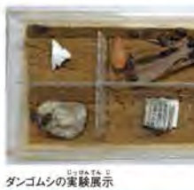
ダンゴムシの実験展示