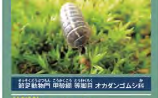
学名: Armadillidium vulgare 生息地: 移入種として世界中

よくみかけるダンゴムシは正式名称を「オカダンゴムシ」といいます。元々日本には生息していませんでした。原産地はユーラシア大陸だと考えられており、明治時代に荷物として、船で運ばれてきたのではないかとされています。