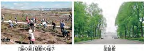
「海の森」植樹の様子

ちなみに、都民のみんなの募金によって「海の森の植樹」や「街路樹の倍増」を達成することができたんだって。