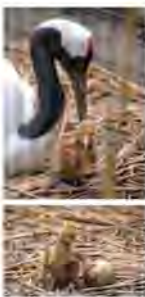
ツルの仲間の中で、日本では繁殖するのはタンチョウだけです。直径1m程の巣を地面に作り、1〜2個の卵を産んだ後、抱卵(卵をあたためること)と子育てを夫婦で協力して行います。2014年から当園で飼育している2羽のタンチョウペアが、昨年4月16日と19日に、点々模様の卵を計2個産み、抱卵する姿が観察できました。

抱卵から約1カ月後の5月19日、卵に約3cmの穴があき、「はし打ち」(ヒナがくちばしで殻を割る行動)をし、薄茶色のヒナが元気な姿を見せてくれました。21日には2羽目も誕生し、タンチョウペアの子育てがはじまりました。