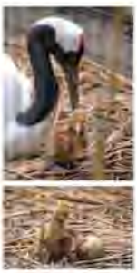
ツルの仲間の中で、日本では繁殖するのはタンチョウだけです。直径1m程の巣を地面に作り、1〜2個の卵を産んだ後、抱卵(卵をあたためること)と子育てを夫婦で協力して行います。2014年から当園で飼育している2羽のタンチョウペアが、昨年4月16日と19日に、点々模様の卵を計2個産み、抱卵する姿が観察できました。

抱卵から約1カ月後の5月19日、卵に約3cmの穴があき、「はし打ち」(ヒナが急成長しました。親鳥の愛情を受け、すくすく大きくなりました。)