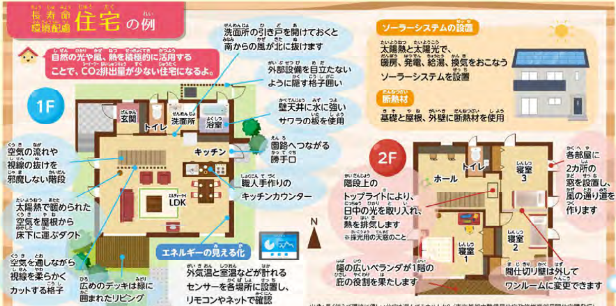
出典:長く使えて環境に優しい住宅を選んでみませんか? (東京都都市整備局住宅政策推進部民間住宅課発行)

「長期優良住宅」の認定を受けた住宅は、土台や柱が劣化しにくい構造のため、耐久性にすぐれている。大きな地震が起きた場合でも、倒壊や損傷を受けにくい対策がされているんだ。建築時から将来を考えて手入れをする