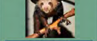
学名:Daubentonia madagascariensis 生息地:マダガスカル