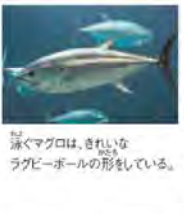
泳ぐマグロは、きれいなラグビーボールの形をしている。

大形原を泳ぎ続けてエサを求めている。マグロが暮らしているのは、さえないものが何もない「外洋」と呼ばれる大洋の海原です。大洋の航海者と呼ばれるマグロは、この広い海を泳ぎ続ける生活をしていきます。どうしてマグロは泳ぎ続けているのでしょうか。