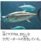
泳ぐマグロは、きれいなラグビーボールの形をしている。

大海原を泳ぎ続けてエサを求めている。マグロが暮らしているのは、さえぎるものが何もない「外洋」と呼ばれる大海原です。大洋の航海者と呼ばれるマグロは、この広い海を泳ぎ続ける生活をしています。どうしてマグロは泳ぎ続けているのでしょうか。