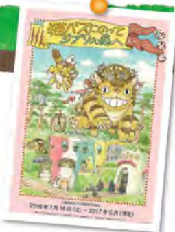
© Studio Ghibli © Museo d'Arte Ghibli

お問い合わせ 0570-055777 詳しくは http://www.ghibli-museum.jp