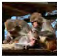
みんなで毛づくろい。

動物園でサル山と言っ たら、ニホンザルを思い浮か べる人が多いのではないで しょうか。そんな中、当園の サル山ではアカゲザルを群 れで飼育しています。 アカゲザルは見た目の似 ているニホンザルとよく同 差するのですが、この2 つのサルは同じオナガザル 科マカク属という種類に分 類される近縁の種類。簡単に 言うと親戚のようなもの なので、とてもよく似てる