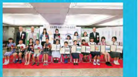
2015年「道路標語・絵画コンクール」受賞者記念写真