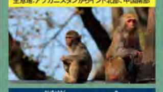
園長目 オナガザル科

学名:Macaca mulatta 生息地:アフガニスタンからインド北部、中国南部