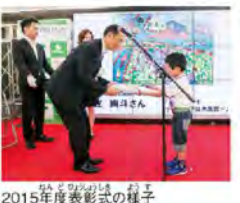
2015年度表彰式の様子

夢のみち道路標語・絵画コンクールは、今年で7回目を迎えます。毎年、東京都内在住あるいは在学している小学生と中学生が対象で、未来を担う子どもたちに、道路に興味・関心をもち、大切にしようという気持ちや意識につなげることを目的としています。 昨年は小学生部門に標語と絵画部門合わせて約1000点の応募があり、今年度のテーマも、「人・街・未来」つながる「みち」づくり ちらも最優秀賞は小学生が受賞しました。 今年度のテーマも、「人・街・未来」つながる「みち」づくりです。人や物運び、街と街をつなぐ道について、「こんな道があつたらいいな」「みんな道で大切にしたいな」という気持ちを標語や絵画にして、応募してみてください。応募してくれた方全員に参加賞をプレゼントします。絵画作品は8月14日(日)~9月23日(金)の間、新宿プロムナード・ギャラリーで展示されます。受賞作品は、8月17日(水)~19日(金)まで展示されます。