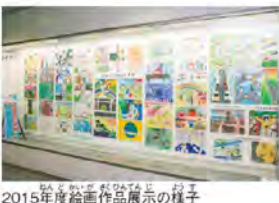
2015年度絵画作品展示の様子