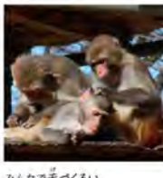
みんなで毛づくろい。

容形はよく似ていても、色んな所が違うサル。動物園でサル山と言ったり、ニホンザルを思い浮かべる人が多いのではないのでしょうか。そんな中、当園のサル山ではアカゲザルを群れて飼育しています。アカゲザルは見た目の似ているニホンザルとよく間違われるのですが、この2つのサルは同じオナガザル科マカク属という種類に分類される近縁の種類、簡単に言うと親戚のようなものなので、とてもよく似ているか?とよく聞かれるのですが、実は動物園ではボスという言い方をあまりしなく、絶対的な力を持ったオナガザルが、群れを統率し、守っていると言われてきました。しかし、