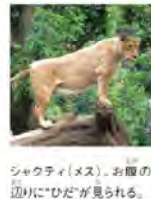
ジャクティ(メス)、お腹の辺りに「ひだ」が見られる。

アジアに生息する最後のライオン テレビでよく見かけるライオンは、約1万年前、北アフリカから西南アジアの広い地域にすんでいました。しかし、人類が生活の範囲を広げたため生息地が減少し、現在はほとんどがアフリカ大陸のサバンナと呼ばれる草原地域で暮らしています。 そんな中、唯、アジア大陸に残り、インドの北西部にあるギルの森に生息しているのがインドライオンです。よく見聞きするアフリカのライオンとは少し違うライオンなのです。 インドにライオンが? 世界で一番小さなライオン。通常のライオンは頭からお尻まで最大250cmと大きな体をしていいますが、インドライオンは頭からお尻まで195cmと小柄なことがわかります。また、ライオンはネコ科の動物では珍しく、「プライド」と呼ばれる群れを作り、社会性を持つことが知られています。プライドは小さな雄と多数の雌による20頭前後の大きな群れですが、インドライオンの場合は、森林に生息し、群れも小さく6頭程度です。アフリカのライオンは雌が中心