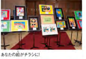
あなたの絵がチラシに!