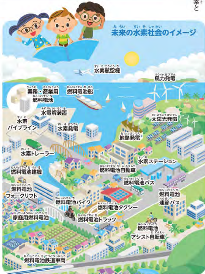
これらは代表例であり全てを網羅しているものではありません。開発中、開発前の用途を含まず。