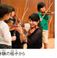
楽器体験の様子から

指揮者やオーケストラメンバーと話をする機会があったり、毎年最後の回にステージで一緒に演奏することもあるのよ。オーケストラも、行ってみたいよ。