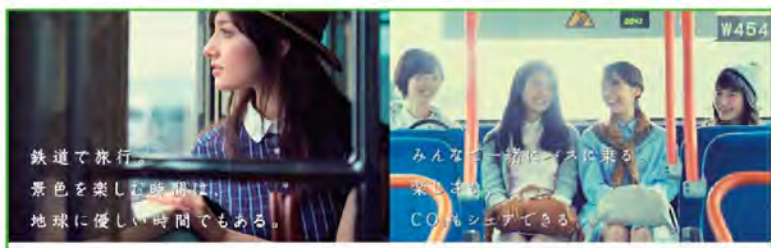
鉄道で旅行。景色を楽しむ時間は、地球に優しい時間でもある。みんな一緒にバスに乗る。CO2もシエラできる。