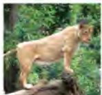
シャクティ(メス)。お腹の辺りに「ひだ」が見られる。

アジアに生息する最後のライオン テレビでよく見かけるライオンは、約1万年前、北アフリカから西南アジアの広い地域にすんでいました。しかし、人類が生活の範囲を広げたため生息地が減少し、現在はほとんどがアフリカ大陸のサバンナと呼ばれる草原地域で暮らしています。