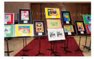
あなたの絵がチラシに!