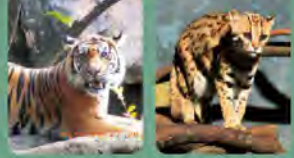
スマトラライオン(インドネシアのスマトラ島に生息) バンガールヤマネコ(アジア南部の森林地帯に生息)