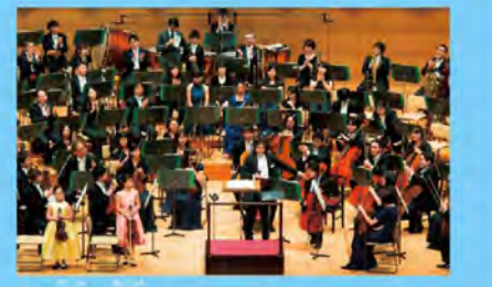
こども楽団の演奏から

12月に演奏会を行います。指揮者とソリストは、テーマごとに異なります。コンサートの中ではクラシック音楽について、わかりやすく解説するのでぜひ一度足を運んでみてください。