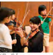
楽器体験の様子から

東京交響楽団とサントリーホールが主催する「こども定期演奏会」は、今年で15周年を迎えます。こどもたちが定期的にコンサートホールに行く習慣を身につけ、生活の中にクラシック音楽を取り入れてもらいたいという願いを込めた日本初のこと も向けのオーケストラ定期演奏会です。 この演奏会の特徴は、聴くだけでなく、こどもたちが参加できるようないろいろな試みを行っていることです。チラシやポスターの絵を描いてもらったり、テーマ曲を広く募集することも、その一つ。 指揮者やオーケストラメンバーと話をする機会があったり、毎年最後の回にステージで一緒に演奏することも私たちのオーディションも行っています。