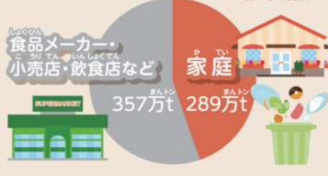
図1 日本の食品ロス年間646万t (平成27年度) ※国による推計

「食品ロス」は、まだ食べられるのに捨てられる食品のこと。日本の食品ロスの量は646万tで、国民1人当たりで考えると、1年間で51kg、1日ですら139gにもなるんだ。これは毎日、赤ちゃんからお年寄りまで、日本国民がお茶わん約1ばい分のご飯を捨てていることになるんだって。