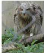
魚にらむシマフクロウ