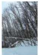
動物園横の旭山公園。太い木はありません

シマフクロウが生活するのに大切な物が大きく2つあります。1つはえさとなる魚。もう1つが繁殖するために必要な大きな木です。その2つの大木が少なく