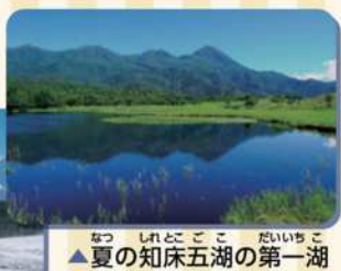
夏の知床五湖の第一湖