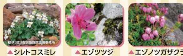
シロトコスミレ ▲エゾツツジ ▲エゾノツガザクラ