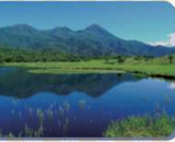
▲夏の知床五湖の第一湖