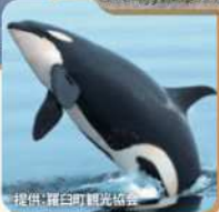
▲シャチの大ジャンプ