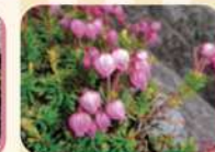
▲エゾノツガザクラ