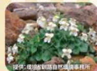
▲シレットコスミレ