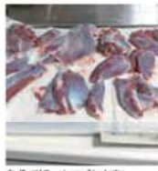
自分で捕ったエゾシカ肉

エゾシカを駆除する と聞いて 前号で紹介したとおり、エゾシカが増えすぎてしまったことが、北海道では大きな問題となっています。その原因には、私たち人間がエゾシカを絶滅させてしまったことが関わっています。動物園の飼育員として自分に何かできないかと考えました。そこで私は今から6年前にハンターになり、エゾシカの駆除に参加することにしました。