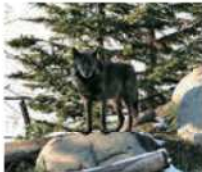
旭山動物園で飼育しているシロシカ