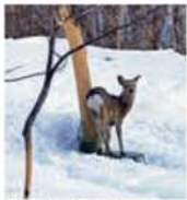
樹皮を食べられた木

現在、エゾシカが増えすぎてしまっているという問題が起きている。エゾシカの食糧は植物で、冬になるとエゾシカは食べるものが少なくなり、極限まで樹皮を食うようになります。木は樹皮を一周食べられてしまうと、かたまりで死んでしまいます。木が死んでしまうと、エゾシカは食べられなくなり、森で暮らしている動物たちは住む場所がなくなってしまう。また、畑にエゾシカが入り、農作物を食べしてしまうことも大きな問題となっています。