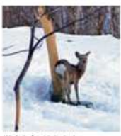
樹皮を食べられた木

現在、エゾシカが増えすぎてしまっているという問題が起きている。その中でも、エゾシカの食糧となる植物が少なくなっている。冬になるとエゾシカは食べる植物が少なくなり、積極的に樹皮を食べるようになります。木は樹皮を一周食べられてしまうと、ほとんどエゾシカに食べられて枯れてしまったり、森で暮らしている動物たちはすみ場所がなくなってしまう。また、畑にエゾシカが入り、農作物を食べしてしまうことも大きな問題となっています。