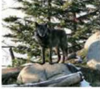
旭山動物園で飼育しているシシノオカミ

エゾシカは1800年代後半に絶滅が心配されるほど少なくなりましたが、原因は、人間による狩猟や大雪による大量死です。そのころ北海道には、エゾオオカミがいました。エゾシカを食べていたエゾオオカミは、エゾシカが少なくなり食べるものが少なくなりました。人間が飼育している家畜をおそうようになっただけで、人間がエゾシカと関係がなくなりました。そのため人間は、懸賞金をかけるとして、エゾシカを捕らせたのです。