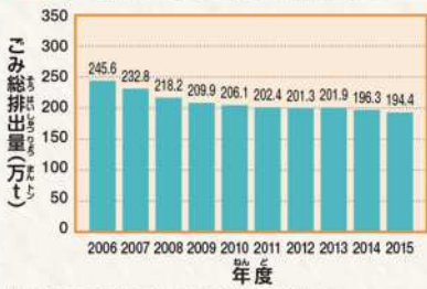
図1 北海道のごみの排出量

北海道環境生活部環境局循環型社会推進課 一般廃棄物処理事業実態調査結果の概要(平成27年度実績)