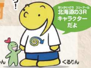
図2 今日から チャレンジ! 3Rの取り組み

そこで、各市町村では、ごみの減量やリサイクルに取り組んでいるよ。「分ければ資源、混ぜればごみ」。これまでごみとして捨てていた物も、きちんと分けていけば資源にすることができるとんだ。 北海道では、3R(Reduce・Reuse・Recycle)の量減らす・再利用(物をくり返し使う)・Recycle(使い終わった物を資源として再び利用する)の取り組みを進めているよ。実際に私たちにどんなことができるか、図2でくわしく見てみよう！