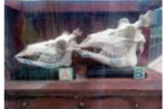
頭骨を展示しているので前歯を確認してみよう

エゾシカは体が一番大きく、大人のオスになると体重が100kgをこえます。エゾシカは北海道全域に生息していて、特に道東にはたくさん生息しています。