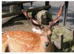
新しく生えてきた袋角

シカの仲間の特徴は、やはり、角です。エゾシカの角はオスにしかありません。この角を使って、オスはアスをめくって争い