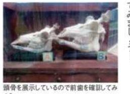
頭骨を展示している前で前歯を確認してみよう

エゾシカは体が一番大きく、大人のオスになると体重が100kgをこえます。エゾシカは北海道全域に生息していて、特に道東にはたくさん生息しています。