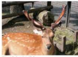
新しく生えてきた袋角

シカの仲間の特徴は、やはり、角です。エゾシカの角はオスにしかありません。この角を使って、オスはススをめくって争っています。